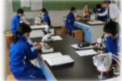
2年生は、理科も2つの教室を活用して、大きな机を広く使って、一人一台顕微鏡での観察をしながらスケッチしました。