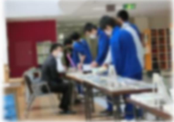
ウイズコムの出張図書もありました。