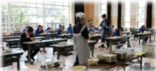
給食は食堂で、左右前後、距離をとり、前を向いて、新たな食事のルールをしっかりと守って落ち着いて食していました。また、衛生面に配慮し、配膳は教職員で行いました。

新型コロナウイルスとの共存が言われ始めています。臨時休校中、教員も学び合い、授業づくりや安全な学校生活づくりのため工夫を重ね、町教委に協力してもらい、“新たな”学校生活を確立するために、様々な体制で取り組みました。