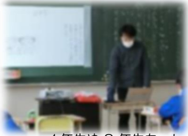
1年生や3年生も、しっかりソーシャル・ディスタンスをとって授業に取り組みました。