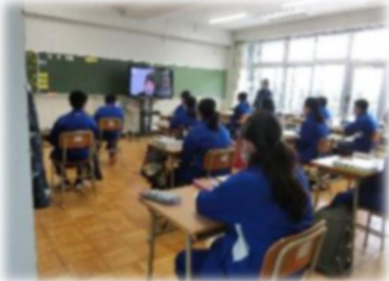
2年生は、2つの教室に分かれて、リモートで先生と繋がり授業を受けました。

4月20日から続いていた臨時休校。そんな中、5月18日(月)の週から分散登校を始めました。1年生は火・金曜日、2年生は月・木曜日の週2日、3年生は火・水・金曜日の週3日でした。生徒は元気に登校し、久しぶりに校内が明るく活気づきました。