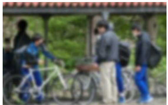
分散登校期間中の自転車点検の様子

道路はいろいろな人、様々な乗り物が行きかっています。『交通ルール』を守るのは当然のこととして、誰に対してもやさしい運転になるように、周りへの配慮・注意を大切に、安全運転を心がけましょう。各家庭でもご指導をお願いします。