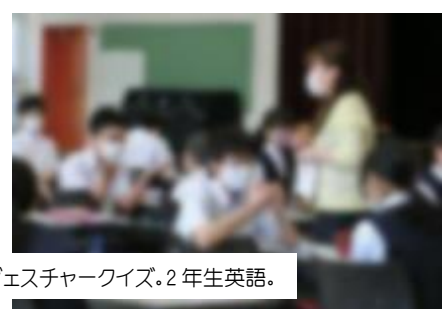
対面でジェスチャークイズ。2年生英語。