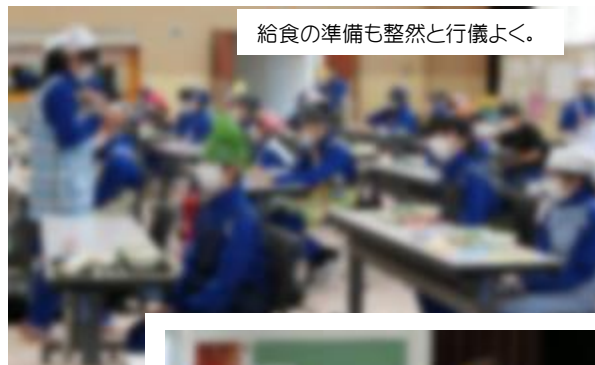
給食の準備も整然と行儀よく。