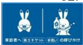
来訪者へ「着エチケット」手洗いの呼びかけ