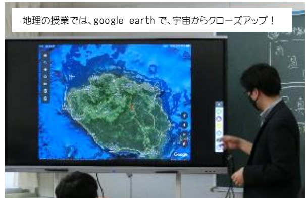
地理の授業では、google earth で、宇宙からクローズアップ！