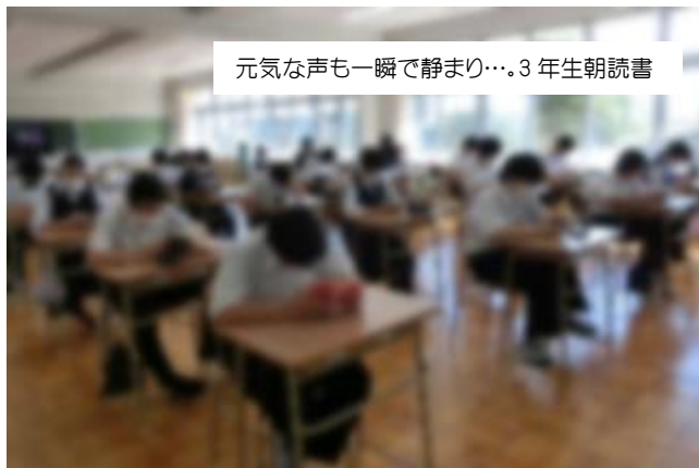
元気な声も一瞬で静まり…。3年生朝読書

学校再開初日から、通常の学校生活が始まりました。授業中はもちろん、朝も昼食時も、放課後も、しっかり過ごさせて立派です。