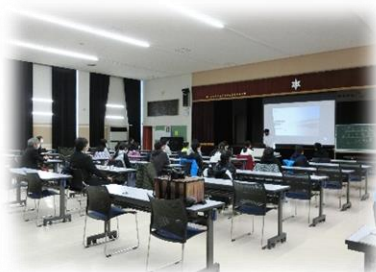
生徒会役員が制作したスライドを真剣に見る6年生。

また、同じ時間帯の別室で保護者説明会も実施しました。多くの保護者のご参会、ありがとうございました。