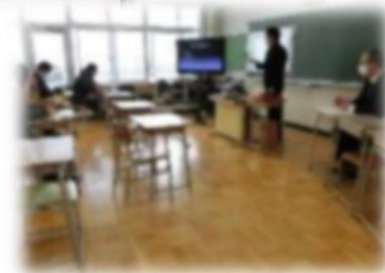
保護者説明会は児童たちとは時間をずらし、別室開催としました。