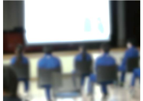
器楽部も生演奏ではなく、動画で3年生へ感謝を伝えました。