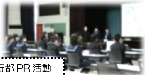
寿都 PR 活動