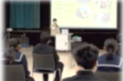
卒業生を講師に迎えた進路学習