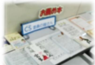
委員から生徒へのメッセージを掲示

生徒ひとりひとりが夢や目標に向かって切り開く力を育めるよう、CS委員が学校の応援団としてバックアップしていきます。