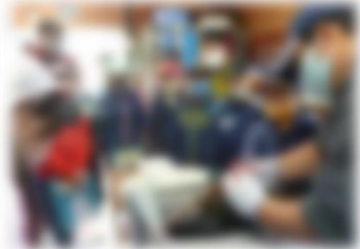
地域資源を活かした授業

昨年度より大きく委員が入れ替わり、これまでの取り組みに新しい風が吹き込まれています。今年度も学校と地域のさらなる相互理解に努めます。