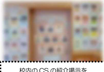
校内のCSの紹介掲示を 見やすく・わかりやすくしました