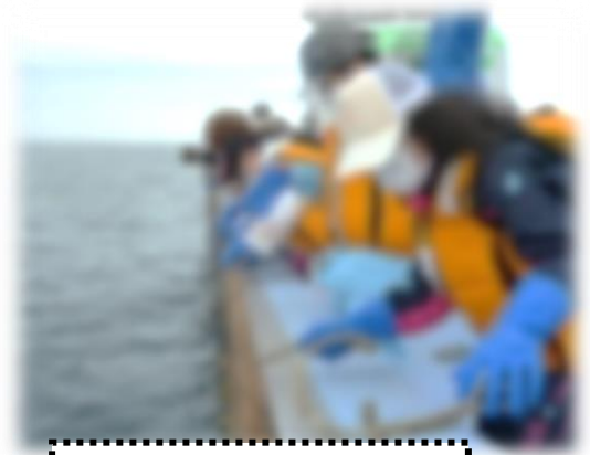
カキの養殖作業体験