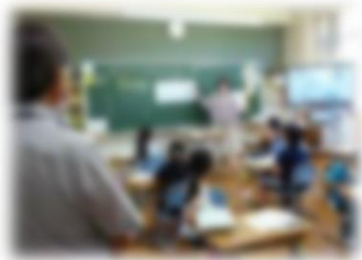
昨年の学校視察の様子

今年度も、児童が委員をはじめとする地域の方々に関わり、学び、おしよろっ子の成長を地域ぐるみで見守っていきます。