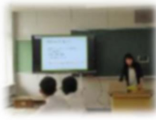
マインドマップの作成