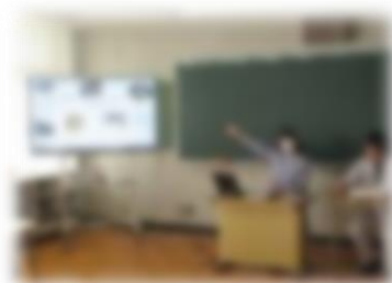
観光プログラムの講評