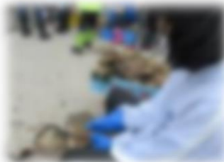
カキの洗浄選別体験