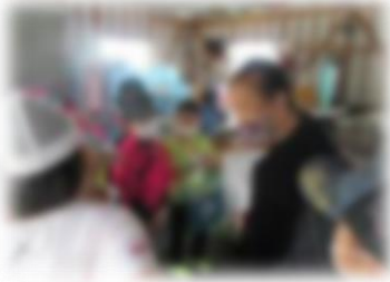
地域の方に支援いただいた授業

昨年度、学校運営協議会で話し合われた内容を基に遠足「ぐるっと寿都」を開催しました。今年度も学校と地域のさらなる相互理解に努めます。