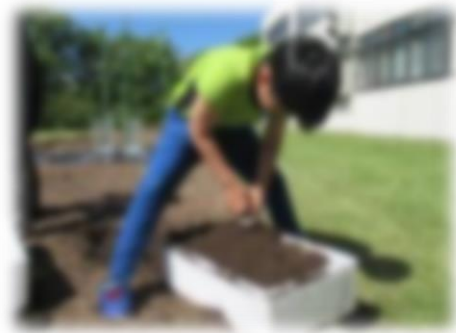
お米の苗植え体験