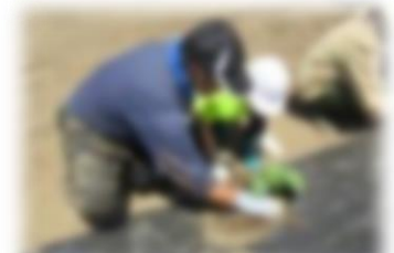
ハロウィンかぼちゃの苗植え