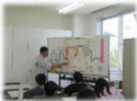
清掃センター見学