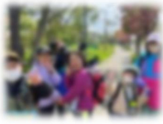
遠足「ぐるっと寿都」